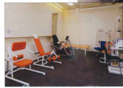
トレーニング ルーム