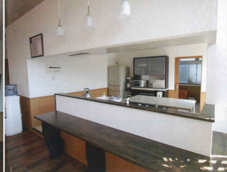
開放的空間のカウンター