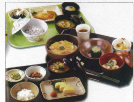
お食事は一例です