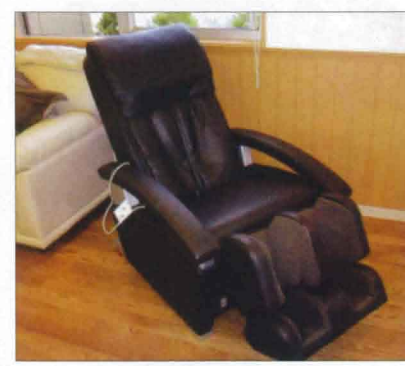
マッサージチェア