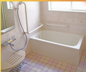
プライベートバス